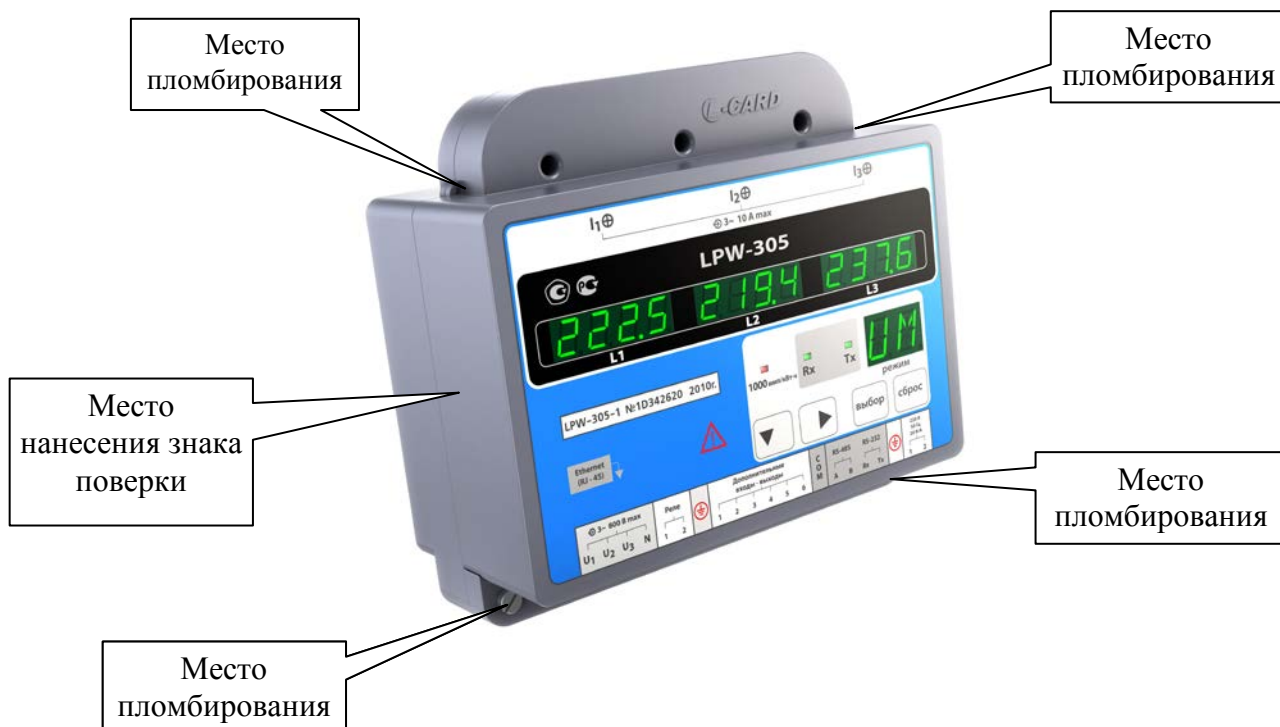
Рисунок 2 – Внешний вид измерителей с креплением на DIN-рейку, места их пломбирования и нанесения знака поверки